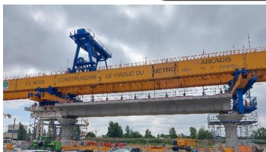
Poutre de lancement